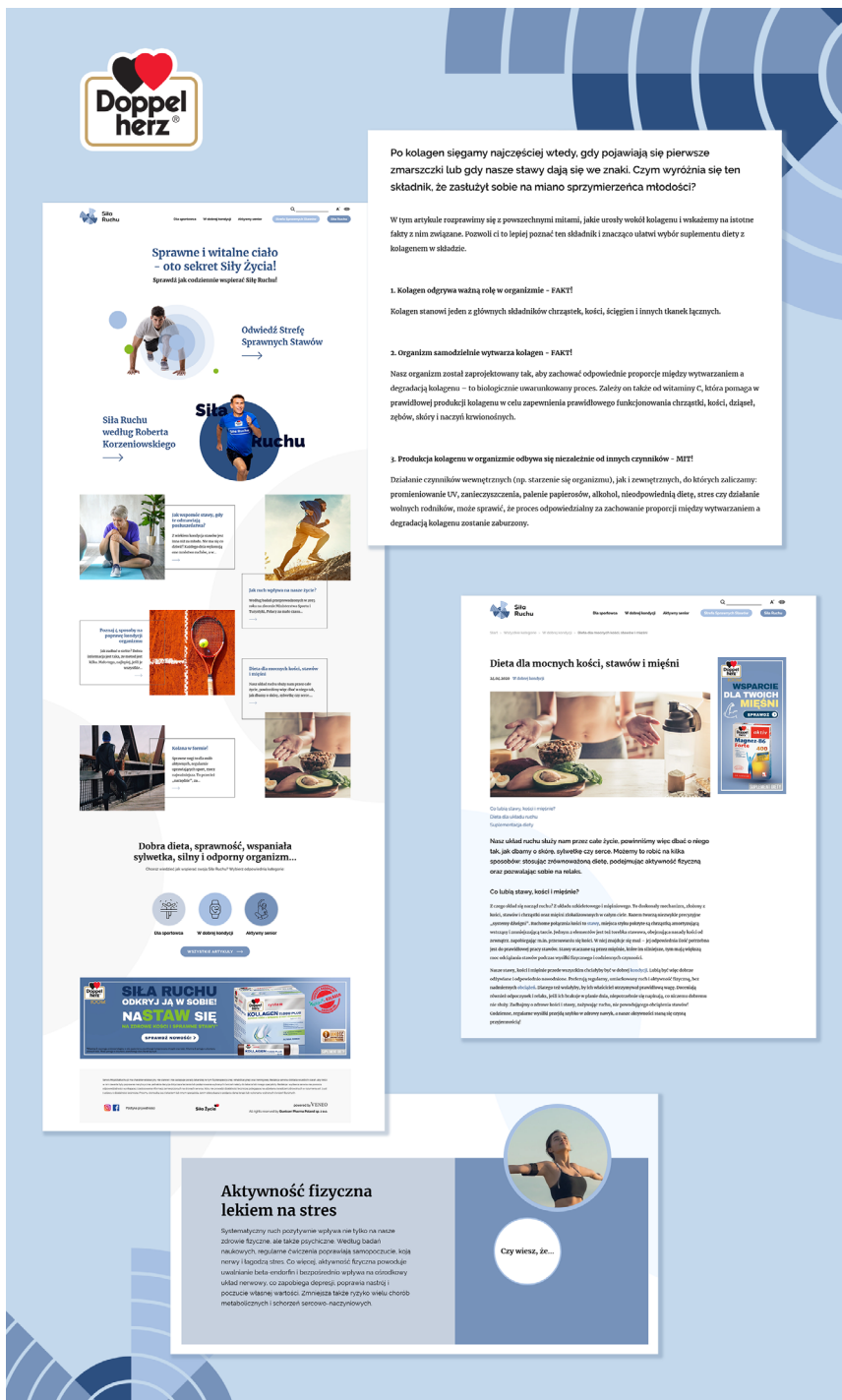
[h.] Przykłady różnego rodzaju contentu na dedykowanym landing page'u www.mojasilaruchu.pl.

Uwaga! Wszelkie źródła badań naukowych i opinii należy weryfikować, tak samo, jak każde inne hiperłącze, które zamierzamy umieścić na stronie www promującej suplementy diety. Odpowiedzialność za treści znajdujące się w podlinkowanych źródłach należy do producenta/właściciela strony, a dokładnie: podmiotów prowadzących działalność zarobkową z tytułu posiadanej strony.