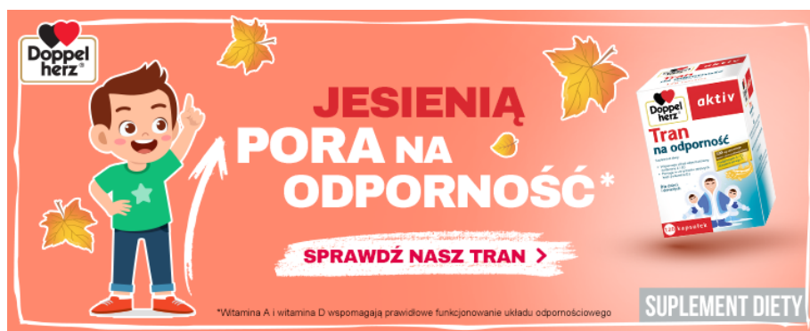
[f.] Baner reklamowy suplementu diety Doppelherz aktiv Tran na odporność.

To jedyna słuszna droga, która godzi interesy prawa i specjalistów od reklamy, którzy chcą zaprezentować produkt w możliwie jak najbardziej czytelny, atrakcyjny i wzbudzający intencję zakupową sposób.