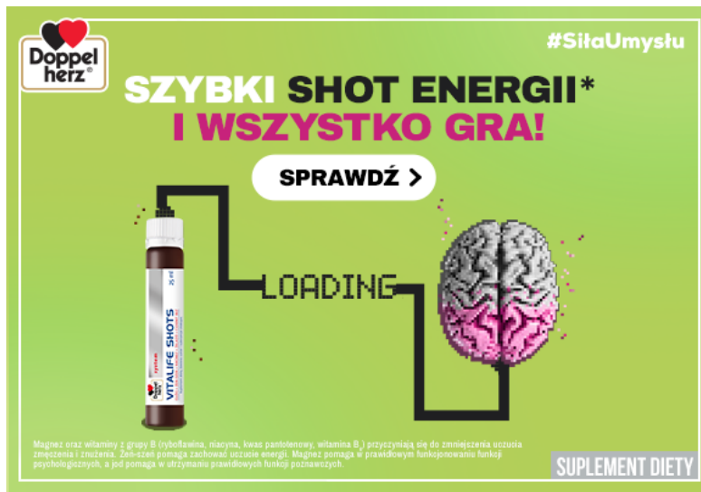
[d.] Baner reklamowy Google Ads suplementu diety Doppelherz system VITALIFE SHOTS, pozycjonowany jako SHOT ENERGII.

klamie (internetowej także) mogą być odebrane jako oświadczenie zdrowotne. [19.]